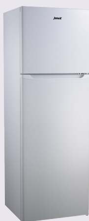
FGJ 355 W