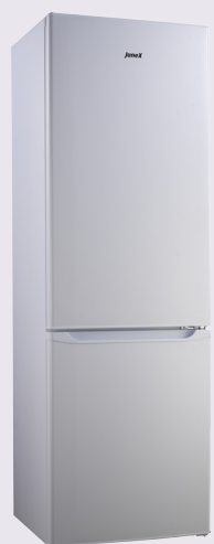
CGJ 360 W

O estilo dos electrodomésticos deste novo catálogo torna-se minimalista, com linhas rectas e simples. A combinação de tecnologia e ergonomia fazem com que os electrodomésticos da Junex estejam à altura das mais altas expectativas dos consumidores.