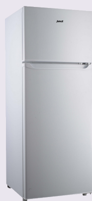
FGJ 255 W